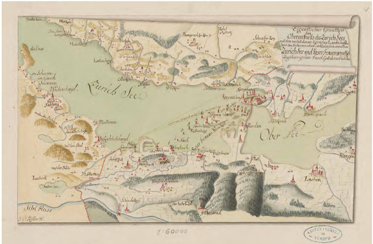
Abb. 3: Eigentlicher Grundriss des oberen Theils des Zurich Sees [...] und unser Frauenwinckel. Kopie durch J. Gd. Keller 1776. Kolorierte Federzeichnung, Format: 30 x 19 cm (Zentralbibliothek Zürich, Kartensammlung MK 633).

(Abb. 2) fait par J. Conr. Romer: 6 Grundriss der Marchen des sogenannten Frauenwinkels [...]. Geometrisch aufgenommen von zwey darzu verordneten Ingenieurs vom Hochlobl. Stand Zürich einerseits und dem Fürstl. Gottshauss Einsidlen anderseits, den 12. April 1769. Das mit Siegeln versehene Original behielt Zürich, während der Entwurf und das Mess-tischblatt, mit den gemessenen Winkeln und Strecken, sowie eine farbige Zeichnung Entwurff nach dem Augenmäss der Marckung des so genanten Frauenwinkels? im Klosterarchiv Einsiedeln aufbewahrt werden. Diese Pläne zeigen, dass die Marchen, das heisst die Pfähle und die Grenzsteine, erneuert wurden, jedoch keine Grenzverschiebungen stattfanden. An der Abschlussfeier nahmen auf dem See 25 Personen, am Mittagsmahl in Pfäffikon 50 Personen teil. 8