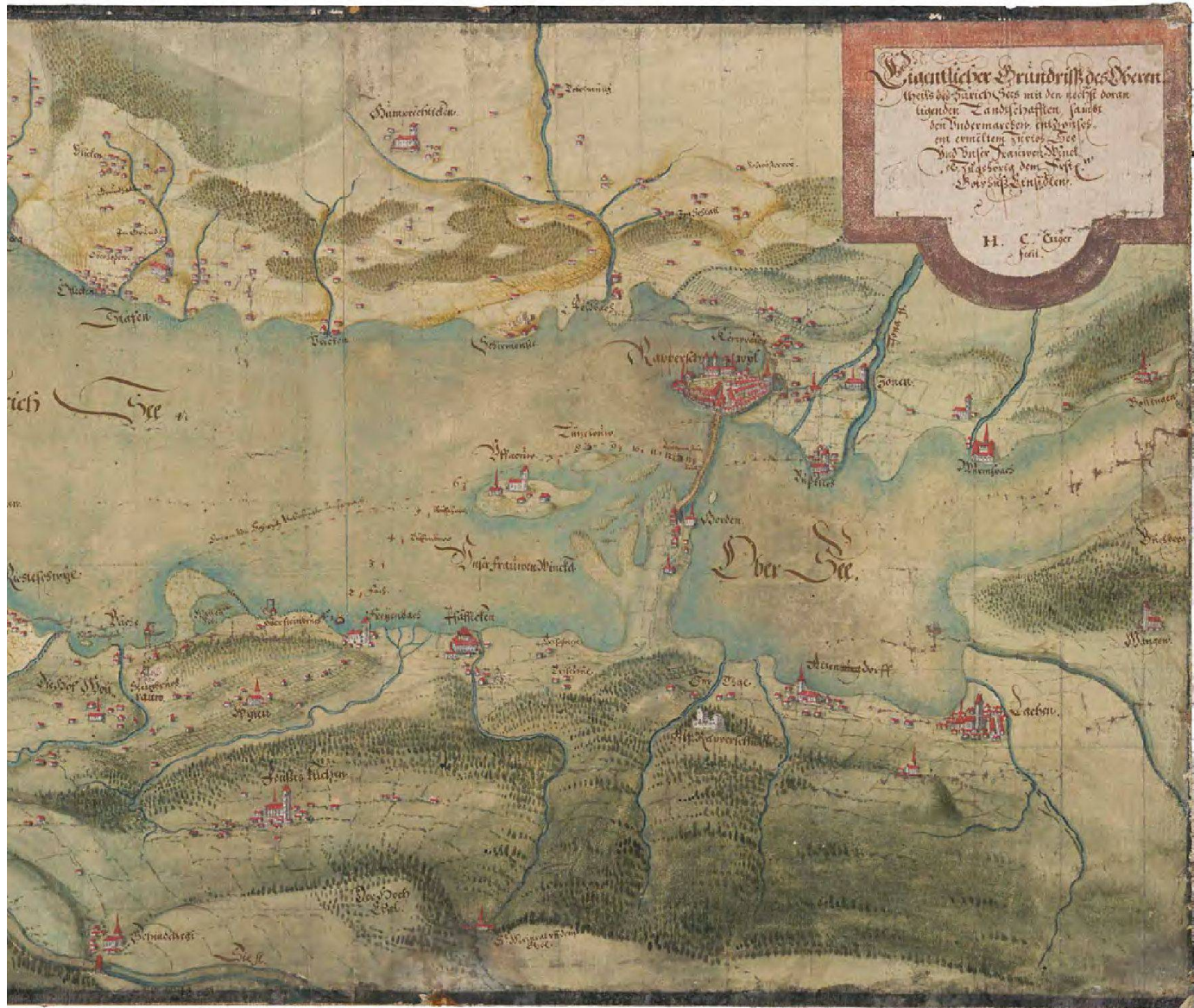
Abb. 1: Eigentlicher Grundriss des Oberen theils des Zürich Sees [...]. Karte des oberen Teil des Zürichsees und des Frauenwinkels von Hans Conrad Gyger, um 1635. Massstab ca. 1:30800, nordorientiert, Kolorierte Federzeichnung, Format: 57 x 35 cm (Zentralbibliothek Zürich, Kartensammlung: MK 2006).