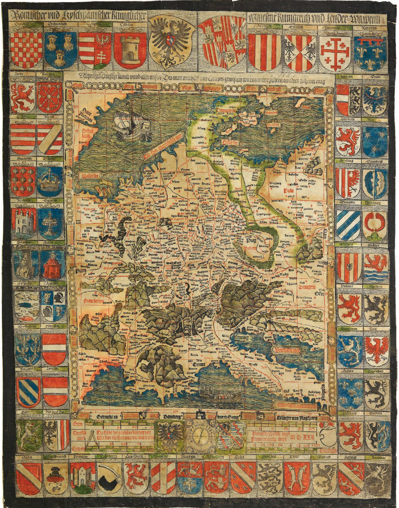
Abb.4: Das neue Exemplar der Germania-Karte Georg Erlingers von 1530, Format: 52,5 x 67,5 cm (Privatsammlung London).