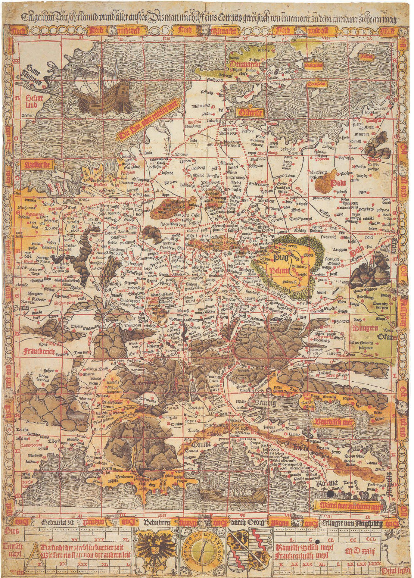
Abb.3: Die zweite Germania Karte Georg Eriangers, erste Ausgabe 1524, Format: 37,5 x 52 cm (aus: Meurer, Germania-Karten, Tafel 2–7).