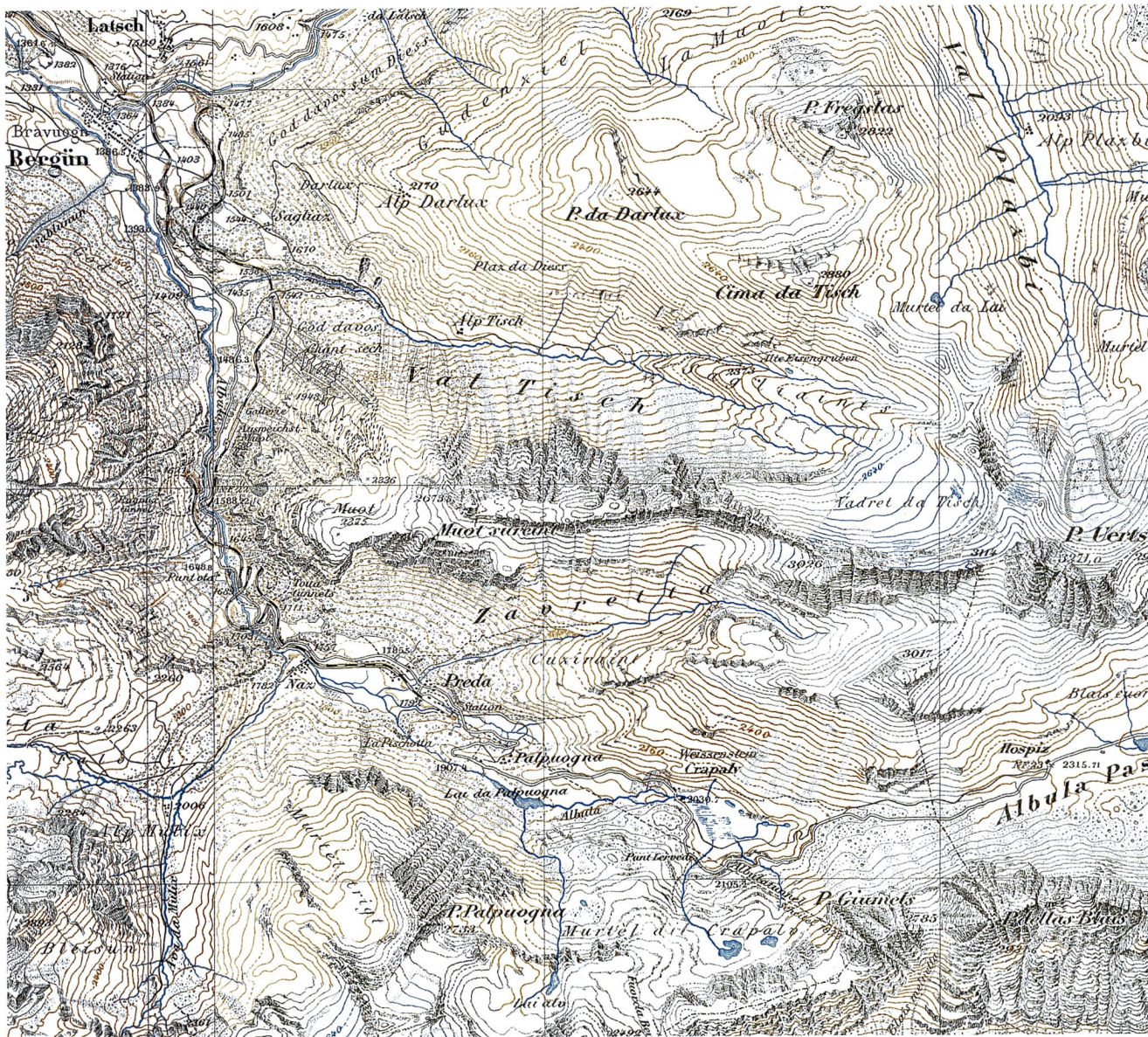
Abb.3: Ausschnitt aus der Siegfriedkarte 1:50 000, Blätter 426 Savognin und 427 Bevers, Ausgabe 1902.