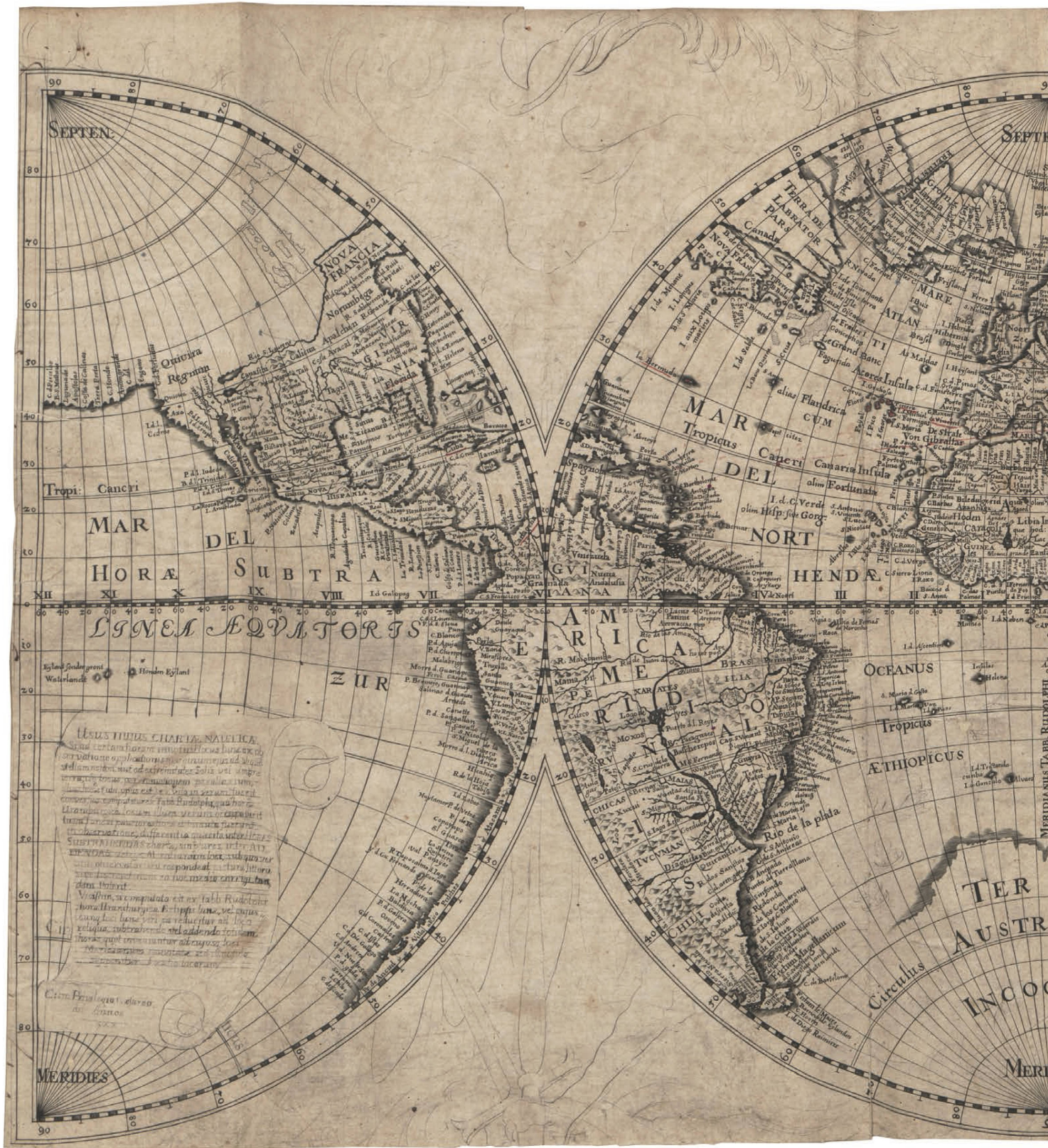
Abb. 5: Der Probedruck der Weltkarte aus dem Jahre 1630, Format: ca. 60 x 32 cm (Universitätsbibliothek Kiel).