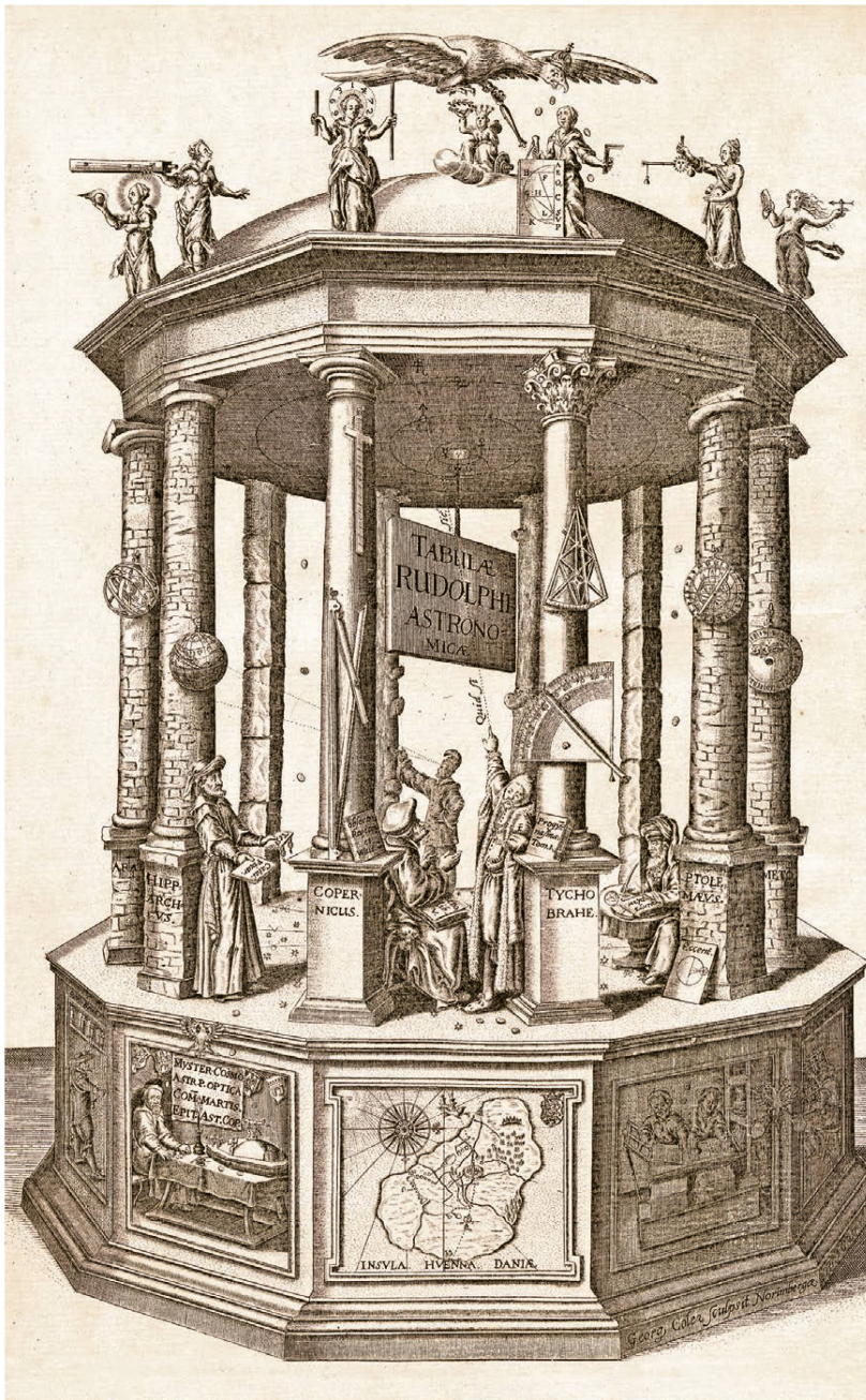
Abb. 2: Frontispiz der Tabulae Rudolphinae , Ulm 1627. Kupferstich von Georg Köler, Nürnberg.

deckung der elliptischen Umlaufbahnen der Planeten umgerechnet. Dazu hat Kepler das zeitgenössisch neue Logarithmensystem nach Jost Bürgi (1552–1632) verwendet, der mit ihm in Prag zusammen gearbeitet hatte. Bereits 1617 bezeichnete Kepler das Werk als zum grössten Teil fertig. Erst Mitte 1624 scheint das Manuskript im Wesentlichen abgeschlossen gewesen zu sein. Im Oktober 1624 war Kepler in Prag, um mit Kaiser Ferdinand II. (reg. 1619–1637) die Realisierung des Druckes zu besprechen. Bei der Drucklegung des bahnbrechenden Werkes, die er selbst organisieren und auch finanzieren musste, erlebte Kepler zahlreiche Rückschläge. 5 Der Druck sollte anfänglich bei seinem Hausdrucker Johannes Planck (tätig 1615–1627) in Linz erfolgen. Nach einem Zerwürfnis mit Planck 1619 nahm Kepler Kontakt zu dem Ulmer Drucker Johannes Meder (tätig 1611–1623) auf. Als dieser starb, wollte Kepler dessen Druckerei erwerben. Dies scheiterte, da dessen Witwe Ende 1624 den aus Marburg zugewanderten Drucker Jonas Saur (1591–1633) heiratete. Weitere Publikationspläne in Linz zerschlugen sich. Am 30.