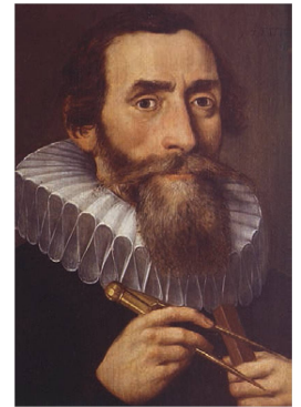
Abb. 1: Porträt Johannes Kepler, um 1610/11, Ölgemälde auf Holz (Benediktinerstift Kremsmünster).