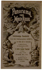
Abb. 78: Panorama vom Monte Rosa. Vollständige Rundschau von der Dufourspitze 4638 m (1878), aufgenommen von Xaver Imfeld. Farbige Lithographie, Ausschnitt verkleinert, Gesamtformat: 252 x 15 cm. Als Beilage im SAC-Jahrbuch, Band 15, 1879/80 (ZB Zürich, SAC).