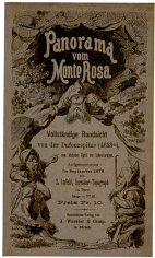
Abb. 78: Panorama vom Monte Rosa. Vollständige Rundschau von der Dufourspitze 4638 m (1878), aufgenommen von Xaver Imfeld. Farbige Lithographie, Ausschnitt verkleinert, Gesamtformat: 252 x 15 cm. Als Beilage im SAC-Jahrbuch, Band 15, 1879/80 (ZB Zürich, SAC).