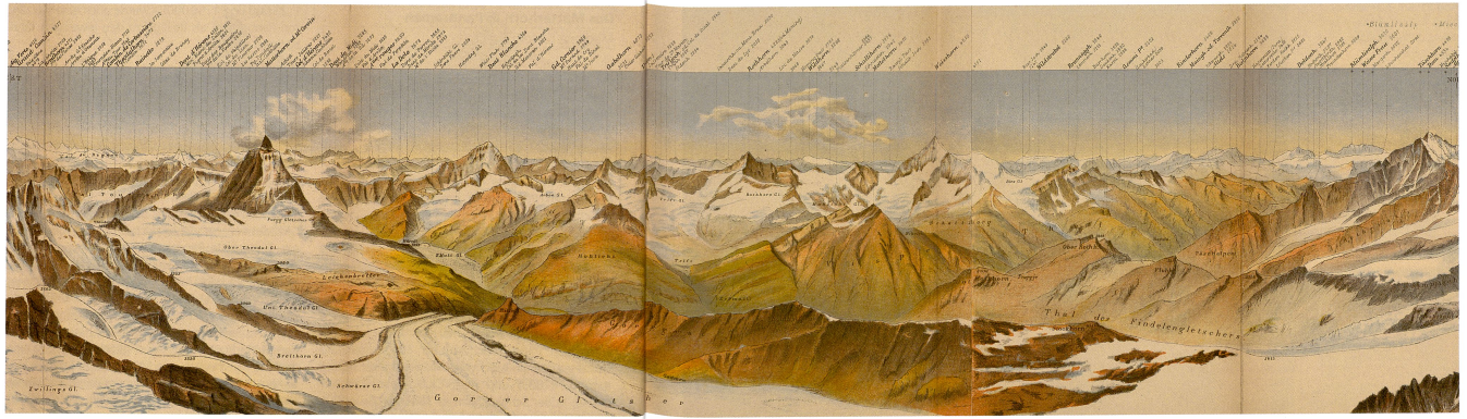
Abb. 79: Entwurf für das Panorama vom Monte Rosa (1878), Lithographie von Xaver Imfeld. Einfarbiger Druck der schwarzen Konturen mit handschriftlich eingetragenen Namen. Ausschnitt verkleinert, Gesamtformat 174 x 15 cm (ETHZ, K 803013).