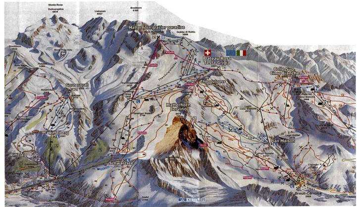
Abb. 80: Skizzen Breuil-Cervinia / Valtournenche / Zermatt. Ausschnitt auf ca. 65% verkleinert. Das Matterhorn ist hier – als Photoansicht hineinkopiert worden (Winfried Kettler, Panorama-Studio, Oftringen).