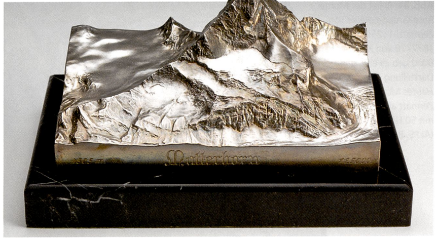
Abb. 83: Werbung für Alpine Briefbeschwerer aus: Alpina XII. Jg. 1904. Zürich, unpag.