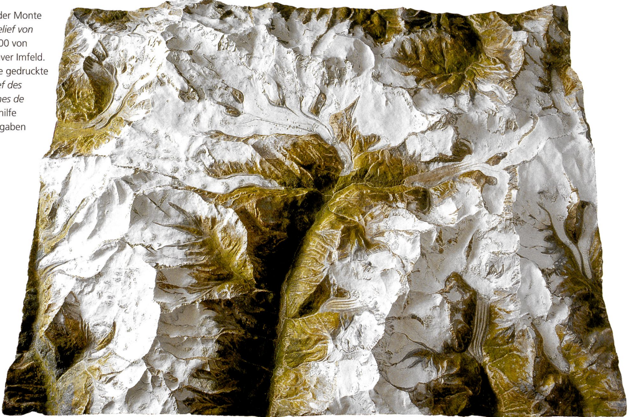
Abb. 84: Relief der Monte Rosa-Gruppe ( Relief von Zermatt ) 1 : 25 000 von 1877/78 von Xaver Imfeld. Dazu gab es eine gedruckte Darstellung Relief des Hautes Montagnes de Zermatt als Lesehilfe mit 50 Höhenangaben (ALPS, Bern).