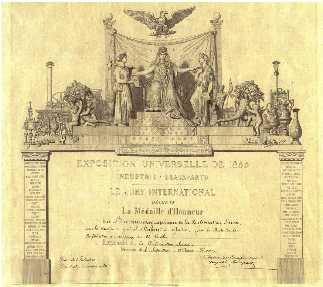
Abb. 73: Urkunde zur Verleihung der Médaille d'Honneur für die Dufourkarte anlässlich der Exposition universelle 1855 in Paris.

produkte wurden 112 grosse Ehrenmedaillen, 252 Ehrenmedaillen, 2300 Medaillen erster, 3900 Medaillen zweiter Klasse und 4000 ehrenvolle Erwähnungen verliehen, zusammengezählt also 10564 Preise. 8 Dieser Klassierung zufolge wurde die Dufourkarte mit dem zweithöchsten Preis ausgezeichnet. In der Literatur findet sich allerdings die Bezeichnung «Goldene Ehrenmedaille», 9 was aber aus der Pariser Preisurkunde (Abb. 73) nicht hervorgeht. Dass der Kaiser der Franzosen diese frühe Ehrung für Dufours Werk unterzeichnet hat, ist hingegen auf der persönlichen Ebene sehr bemerkenswert. Charles Louis Napoléon Bonaparte (1808–1873) war nämlich zwischen 1830 und 1836 ein Schüler von Dufour an der Militärschule in Thun, wo er sich zum bernischen Artilleriehauptmann ausbilden liess. 10 Der Neffe von Napoleon I. und der spätere Napoleon III. hat in dieser Zeit die Ernennung seines Lehrers zum Oberstquartiermeister und den Beginn der schweizerischen Landesvermessung und -kartierung hautnah miterlebt. So wohnte er zusammen mit Dufour im April 1834 zeitweilig der Basismessung auf dem Sihlfeld bei Zürich bei. 11 Er blieb seinem Ausbildner sein Leben lang in gegenseitiger Wertschätzung verbunden. Seine Unterschrift auf der Preisurkunde kann denn auch als dankbare Anerkennung Napoleons III. für das von Dufour Gelernte gelesen werden, auch wenn die Ehrenmedaille von einer internationalen Jury verliehen wurde.