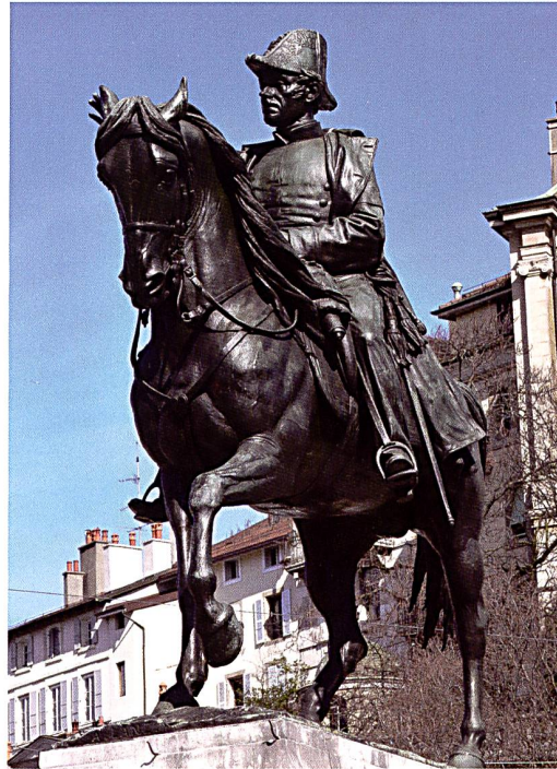
Abb. 75: Das Reiterstandbild Dufour als General. Bronzeskulptur von Karl Alfred Lanz (1847–1907), errichtet 1884 am Place Neuve in Genf. Inschrift: G.H.Dufour – Helvet. Dux MDCCCLXXXVII–MDCCCLXXV. Erigé par souscription nationale MDCCCLXXXIV. Höhe: 390 cm, Länge: 310 cm, Breite: 130 cm.

Denkmäler wollen in der Schweiz verdient sein. Republikanischer Nüchternheit verpflichtet, betrachtet man hierzulande herausragende Menschen bald einmal als Gefahr für die Freiheit: Adrian von Bubenberg wurde aus dem Rat geworfen, bevor man ihm das Kommando in Murten anvertraute, das ihn unsterblich gemacht hatte und die Standbilder des Schultheissen in Bern und in Spiez erklärt. Bubenbergs Zeitgenosse Hans Waldmann wurde geköpft, bevor, Jahrhunderte später, Zürich dem grossen Bürgermeister ein Reiterstandbild widmete. Ausser Waldmann kamen auch der Sieger der Schlacht von Laupen Rudolf von Erlach, der Oberbefehlshaber im Zweiten Weltkrieg Henri Guisan und die der Welt wie der Schweizer Geschichte angehörige Ausnahmestalt Alexander Suworow zu ihren Reiterstandbildern. Das stolzeste von allen aber steht auf der Place Neuve in Genf, dasjenige des Generals Guillaume-Henri Dufour, erstellt vom Bildhauer Karl Alfred Lanz (Abb.75).