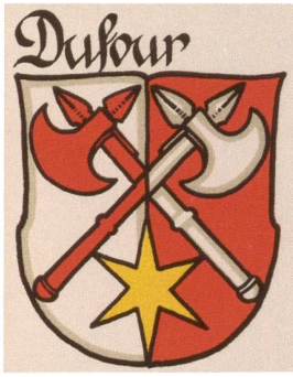
Abb. 78: Das Wappen Dufours als Angehörige der Gesellschaft zu Kaufleuten in Bern.