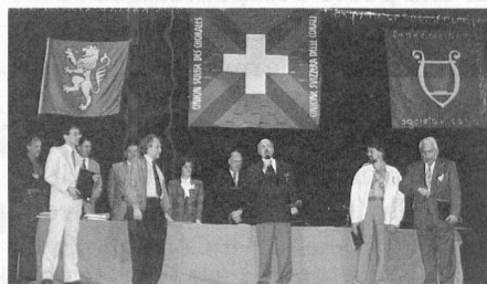
I nuovi Membri onorati dell'USC