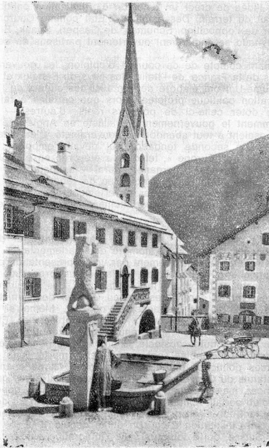
Quelque part dans les Grisons