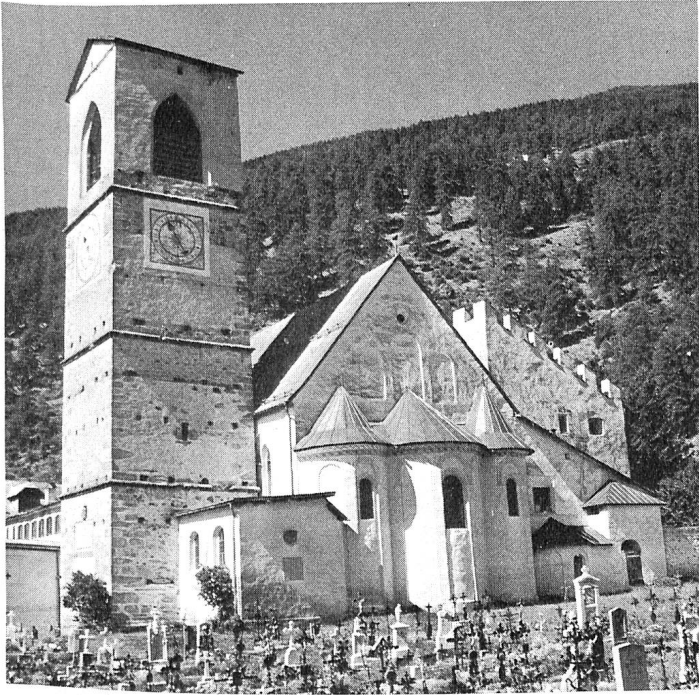
Die Kirche in Müstair, ein Kleinod romanischer Baukunst.