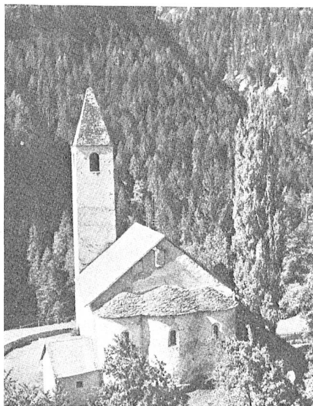
Die praeromanische Kirche St. Peter in Mistail (Graubünden).

Autotunnel, in Bourg-St. Pierre einem besonders schönen romanischen Kirchturm begegnen, einem der ältesten auf schweizerischem Boden.