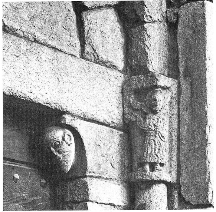
Skulpturen an der Kirche San Nicolao in Giornico/TI.

was eine Seltenheit darstellt – um 1900 sehr geschickt erneuert und zeigt sich heute wieder ganz in der ursprünglichen Form.