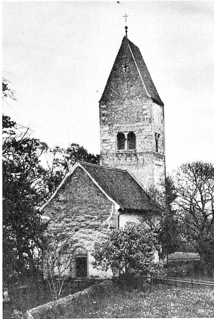
Die reizvolle kleine Kirche auf der Insel Ufenau bei Zürich.

Wir unternehmen nun einen kleinen Abstecher ins idyllische, kleine Fextal, wo wir in Crasta ein wahres kleines Juwel von einer romanischen Kapelle entdecken. Ein weiterer Ausflug schliesslich hat das Puschlav zum Ziel, wo die St. Victor Kirche in Poschiavo immer noch ihren ursprünglichen, prächtigen Turm aus dem 12. Jahrhundert aufweist. Wir begnügen uns jedoch nicht mit Poschiavo, sondern steigen zur kleinen Kirche San Rumedi, hoch über dem blauen See von