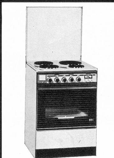
PRÉSIDENT EH 6045