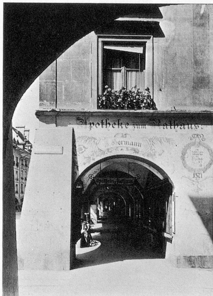
Une arcade de la Kramgasse.

Ils ont une autre notion de l'amusement. S'ils veulent être gais, ils chantent les amours mélancoliques de Vreneli ab em Guggisberg et de son Simeli de l'autre côté de la montagne.