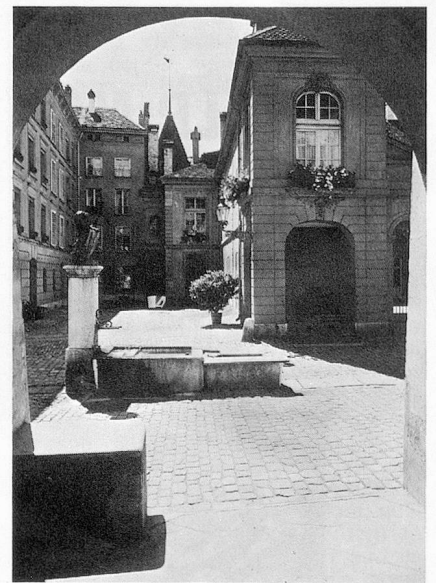
Berne à la française.

L'ancien régime des familles patriciennes a conféré à la ville de Berne un cachet élégant, qu'elle a su conserver en plein 20 e siècle. Les relations étroites de ces familles avec la France, où leurs fils servaient régulièrement comme officiers dans la garde du roi, ont laissé un goût très prononcé pour la culture française. Quoique la ville se trouve bien sur territoire de langue suisse-allemande, le français y est parlé couramment, ce qui donne parfois lieu à un curieux mélange, tout comme en Alsace. On entend fréquemment des tournures telles que «guete bonjour», et «merci» et «s'il vous plaît» remplacent les «danke» et les «bitte». Il y a quelques lustres on pouvait encore voir le nom des rues en deux langues: la «rue des chaudronniers» par exemple côtoyait la «Kesslergasse». La descendance