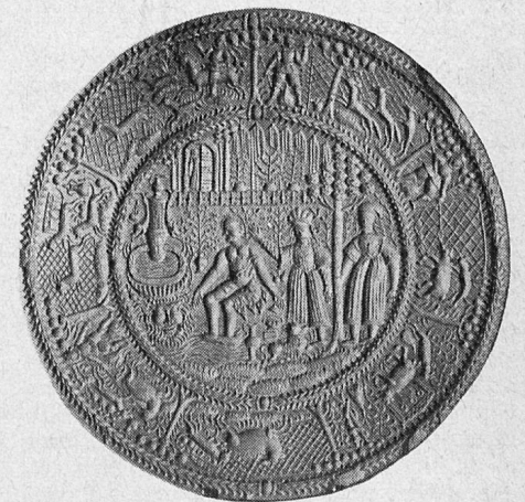
Susanna im Bade (17. Jahrhundert) Formmodel zur Prägung von Tirggeln