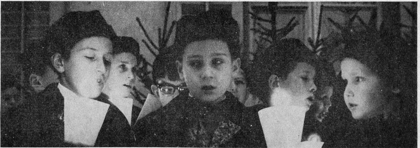
Sternsingen, ein alter Weihnachtsbrauch in Luzern