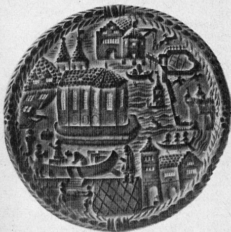
Tirggel mit Stadtansicht von Zürich, Wasserkirche und Kaufhaus. Gebäckmodel aus Holz (Jahr 1706)