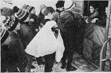
Das Pan Grond wird dem bevorzugten Klassenkameraden überreicht

Woher dieser dem Stefanstage (26. Dezember) zugehörige Brauch kommt, weiß man nicht. Gewiß aber ist, daß er gleichsam alleiniges Besitztum der Gemeinde Scuol/Schuls im Unterengadin ist. Kurz nach dem Mittagessen dieses Tages ziehen die Schulser Knaben schulklassenweise von Haus zu Haus, wo erwartungsvoll die Mitschülerinnen dem Besuche entgegenharren, um dem Schulkameraden ihrer Wahl Pan Grond, das große Brot, zu geben. Womit sie sich zugleich den Kavalier für die bevorstehenden Jugendfeste, vor allem das Frühlingfest „Chalanda Marz“, erwählt haben. In einem Elternhaus versammeln sich darauf die Klassen mit ihren Lehrern zum Zvieri, wo die Pan Gronds mit Kakao und andern Zugaben beim muntern Gesang von heimischen Liedern verschmaust werden. Dann geht's hinaus zur Schlittenfahrt, jede Klasse auf besonderem Schulweg, wo nun der frischgebackene Kavalier erstmals ritterlichen Pflicht nachzukommen hat, nämlich seine „Verehrerin“ — zuweilen ist es nicht bloß eine — auf seinem Schlitten mitzuführen.