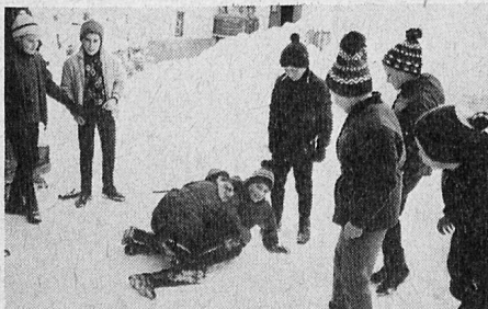
Wird der gleiche Knabe zu oft durch das Pan Grond zum Kavalier auserkoren, rächen sich die Kameraden