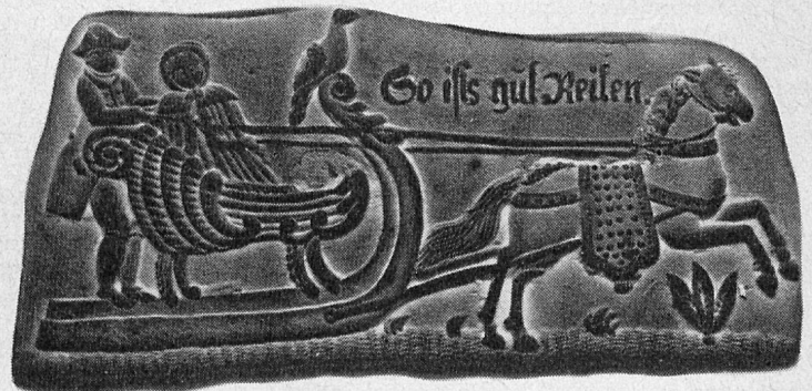
„Tirggel“ eine Spezialität aus Zürich