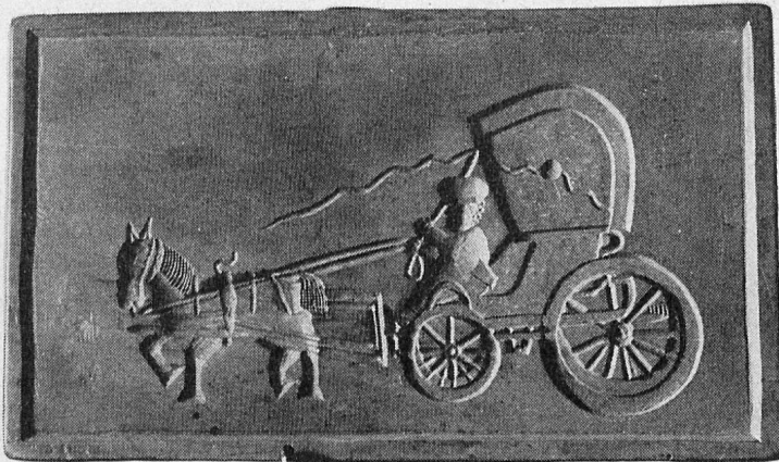
Altes Holzmodel zur Prägung von Tirggeln (19. Jahrhundert)

Mit ähnlichen, nur tiefer gekerbten Formmodel prägt man die Aenisbrötchen, ein Weihnachtsgebäck, oder die in der ganzen Schweiz verbreiteten Lebkuchen aller Art. In vielen Schweizer Familien werden zur Weihnachtszeit nach überlieferten, persönlichen Rezepten und mit den althergebrachten Model traditionsgebundene Bäckereien für die Festtage zubereitet.