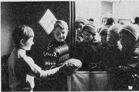
Oft fällt die Wahl des Kavaliers sehr schwer