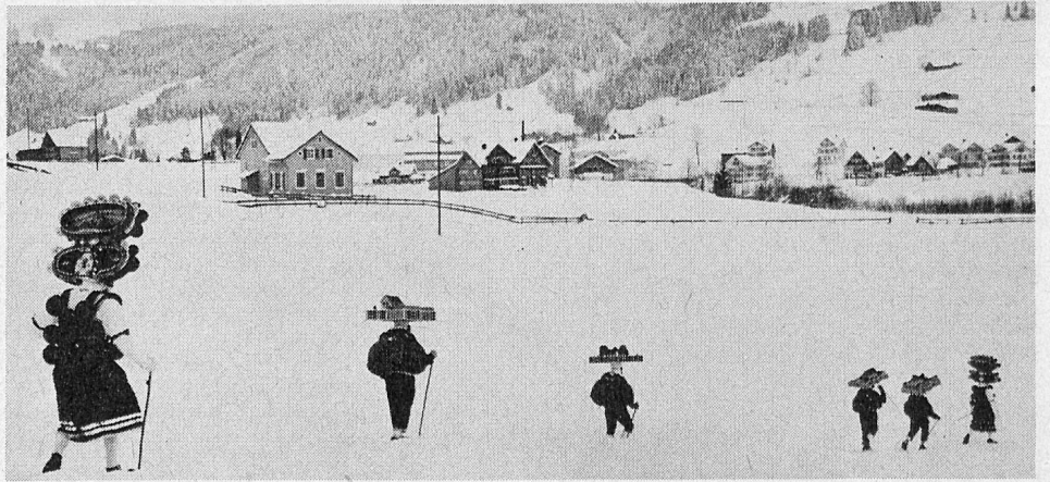
Gute Geister — auch männliche und weibliche Kläuse genannt — stapfen durch den Schnee von Gehöft zu Gehöft rund um Urnäsch