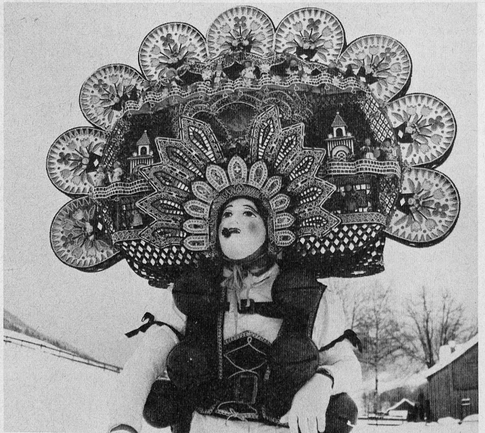
Die „Rollenkläuse“, mit kunstvoll ausgestatteten Tellerhauben geschmückt, blicken durch pausbäckige, starr lächelnde Wachsmasken ausdruckslos in die Welt

phantastisch verkleideten, mit kunstreich gefertigtem Kopfschmuck ange-tanen und mit Schellen schüttelnden Silvesterkläuse von Haus zu Haus. Ursprünglich war es darum gegangen, mit ihrem wilden Lärm die bösen Geister zu vertreiben. Heute machen sie auch mit Jauchzen und Zauern (Jodeln) echt appenzellisch ihrer ausgelassenen Festfreude Luft — und werden dafür von den „heimgesuchten“ Dorfbewohnern mit klingenden Münzen, mit Wein und andern Gaben beschenkt.