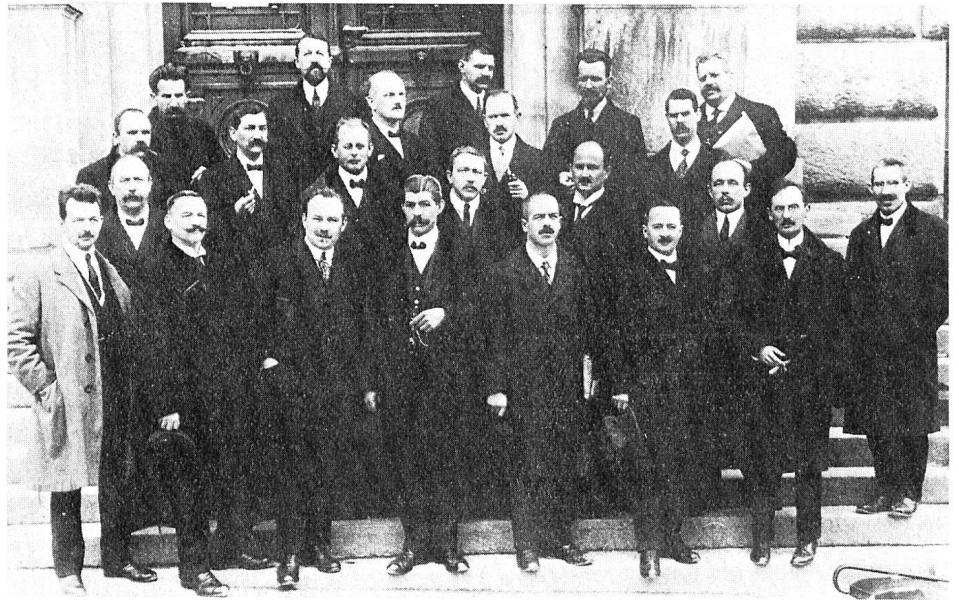
Das Oltener Aktionskomitee im März 1919.

Die zu ergreifenden Massnahmen ergeben sich aus der Natur der Schwierigkeiten. In fast allen Fällen wendet sich der Arbeitgeber an die Organisation, der er selbst direkt angehört, und diese nimmt