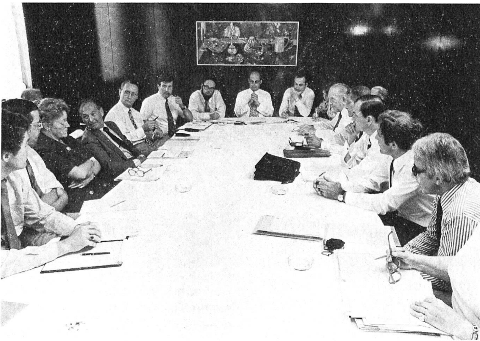
Koordinationsitzung Information.