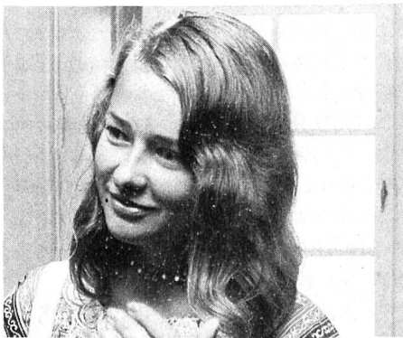
Sitzung des Solidaritätsfonds.