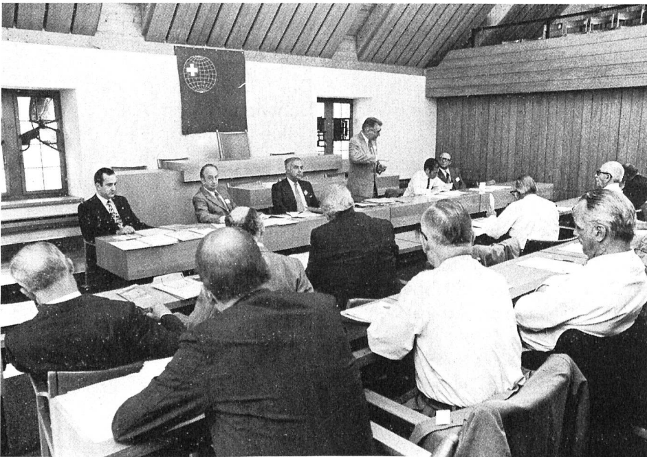
Sitzung der Auslandschweizerkommission.