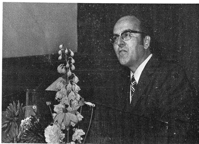
Bundesrat Kurt Furgler.

Stadt St.Gallen sprachen Landammann Dr.Geiger und Stadtammann Dr.Hummler. Für die musikalische Einlage sorgte die Fanfare der St.Galler-Jugend, welche durch ihre Begeisterung und vor allem durch das hohe Niveau, grossen Eindruck hinterliess.