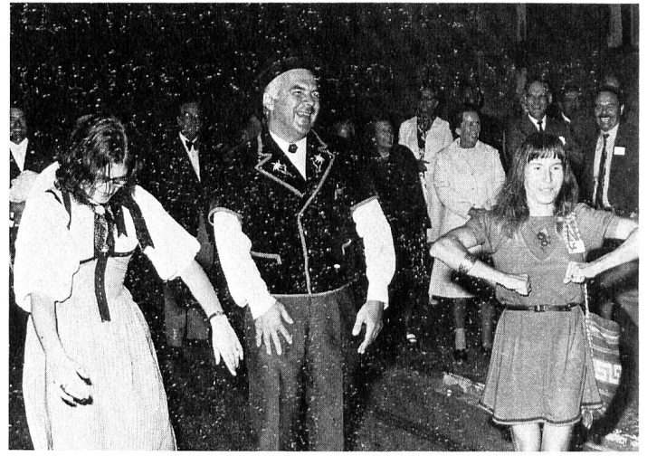
Um einen Tag gut zu beendigen: eine Polonaise.