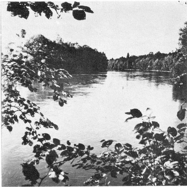
El "Reuss" cerca de Unterlunkhoten