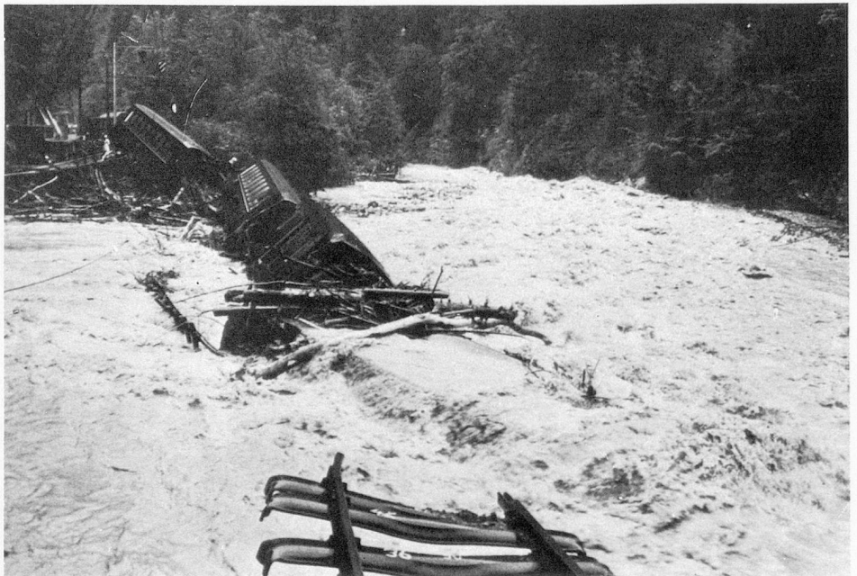
Accidente ferroviario cerca de Davos

El comité de iniciativa de Berthoud deposita en Berna su iniciativa para que en doce domingos al año no sean utilizados vehículos ni aviones a motor. Ha obtenido 117.119 firmas.