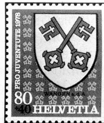
Wangen a. d. A. (BE)

Entwürfe Dessins Disegni Gastone Cambin Breganzona