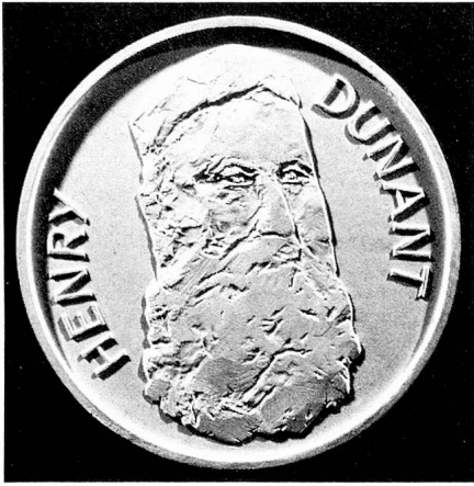
Erinnerungstaler des 150. Jubiläums der Geburt Henri Dunants, ein Werk des Bildhauers Jacques Barman

Vor diesem schrecklichen Schauspiel hat er nur noch den Gedanken, die Verwundeten ohne Unterschied nach Nationalitäten zu retten und die Wiederholung eines solchen Blutbades zu verhindern. Er wendete all seine Kräfte für dieses Werk auf, das 1863 zur Gründung eines Komitees zur Rettung der Kriegsverwundeten führte und zur diplomatischen Konferenz von Genf, womit die Basis des Roten Kreuzes geschaffen war und dessen Zeichen des neutralen und internationalen