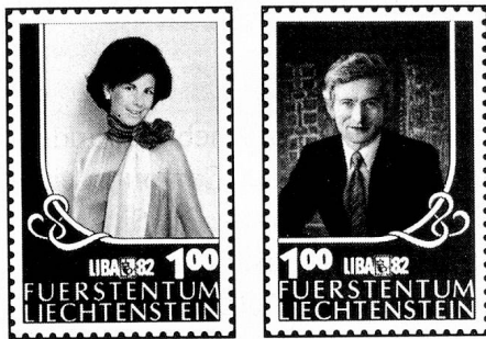
Sondermarken «LIBA '82»