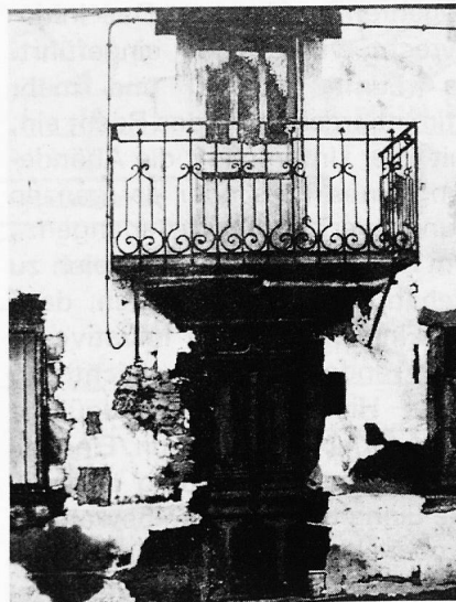
Josef Schibli «Portrait eines Hauses III» (Schweden)

Noch einmal vielen Dank an alle Künstler für ihre Bemühungen und für ihre Teilnahme. Auf Wiedersehen in zwei Jahren. Die Redaktion