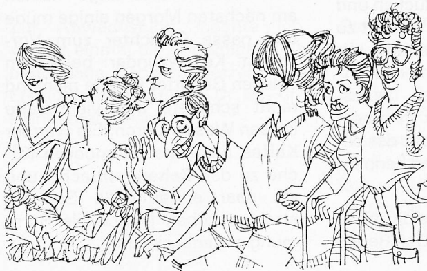
le groupe théâtre connaît un très grand succès...