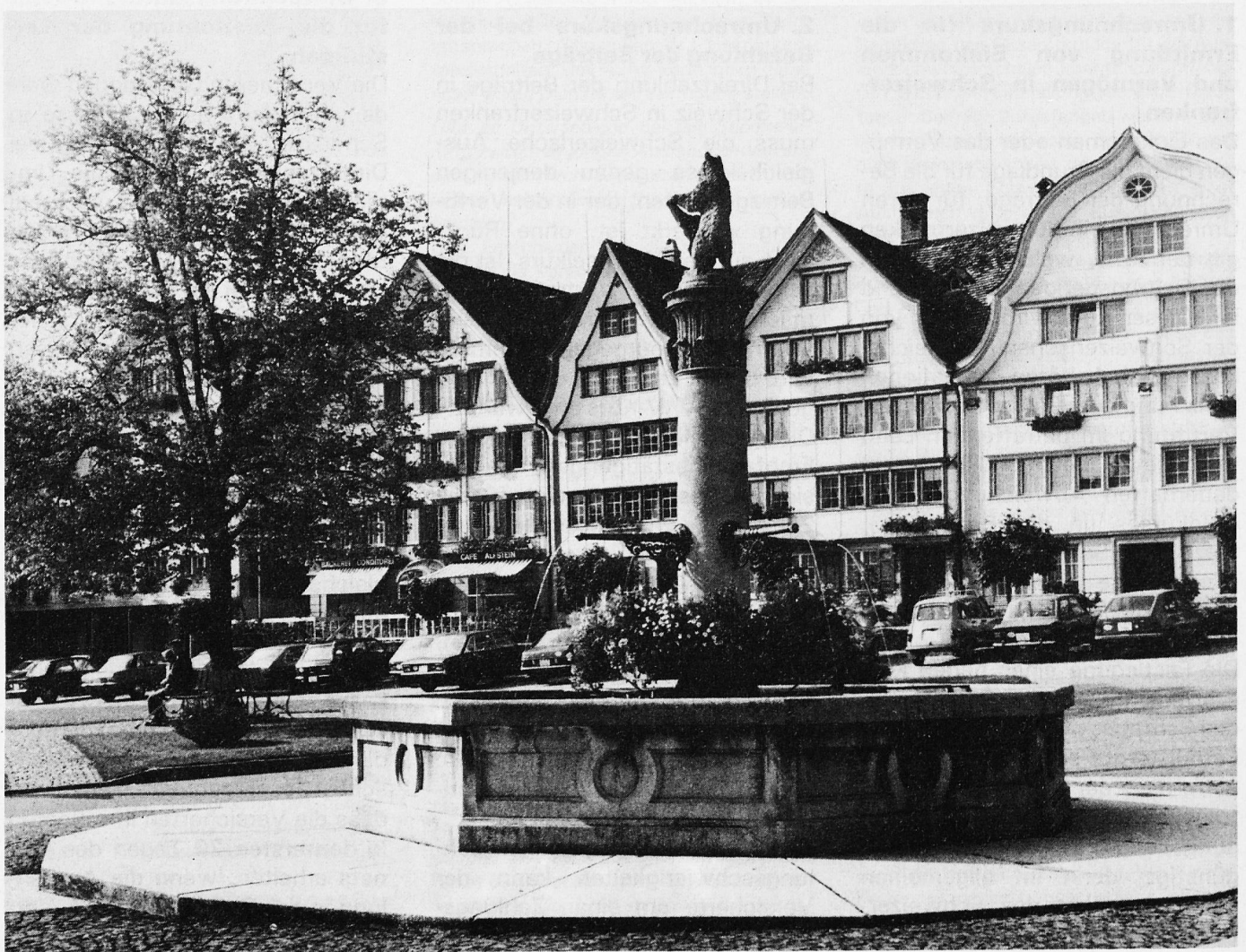
Gais im Appenzellerland