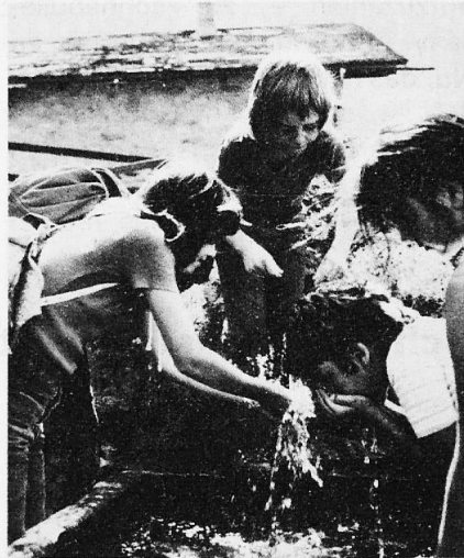
Kinder am Brunnen

Liebe Landsleute, In einer der allerersten Schulstunden lernte ich die wichtigsten Dinge, die der Mensch zum Leben braucht: Luft, Erde, Licht und Wasser. Ich glaube, damals, als ABC-Schütze, wurde ich mir zum ersten Mal der Umwelt bewusst und vielleicht war es gerade jener Lehrer aus längst vergangenen Tagen, der mir die Natur und ihre Zusammenhänge nahe brachte. – Nun, Luft und Licht waren einfach da, ohne dass wir sie suchen mussten. Anders war es aber mit dem Wasser, das, ausser im Haus, nur an Bächen und Seen zu finden war. Doch die guten Stadt- und Dorfväter hatten vorgesorgt. An vielen Plätzen hatten sie Brunnen errichtet, einfache oder raffinierte, zuerst aus praktischen Gründen, denn hier wurde gewaschen, getratscht, und von hier wurde das Wasser nach Hause