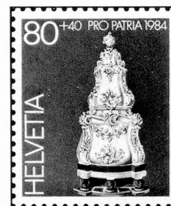
80 + 40 c. Museum Ariana, Genf Musée Ariana, Genève Museo Ariana, Ginevra