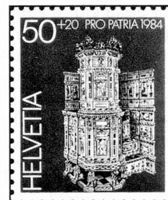
50 + 20 c. Freulerpalast, Näfels Palais Freuler, Nâfels Palazzo (Freuler), Nâfels