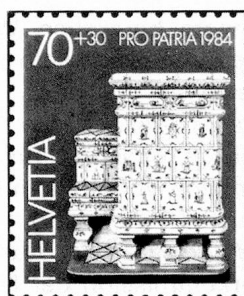
70 + 30 c. Musée gruérien, Bulle