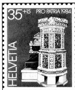
35 + 15 c. Landesmuseum, Zürich Musée nationale suisse, Zurich Museo nazionale svizzero, Zurigo

In diesem Jahr ist das Erträgnis der Bundesfeierspende für das Auslandschweizerwerk bestimmt, welches solche Zuwendungen seit 1924 alle 6 oder 7 Jahre erhalten hat. Empfänger sind insbesondere die Auslandschweizerorganisation und des-