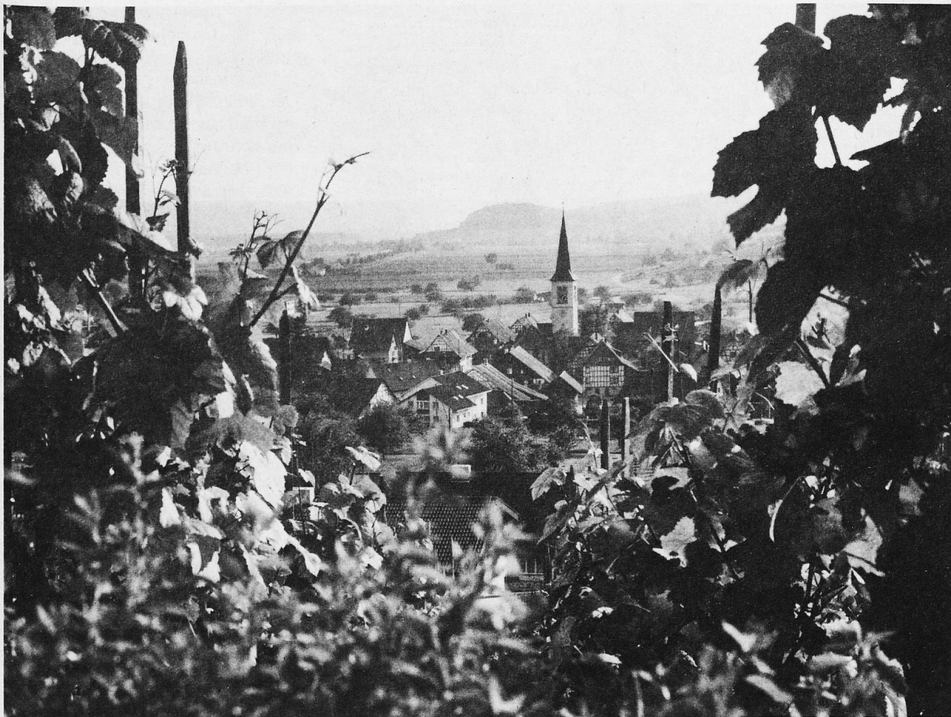
Rafz im Zürcher Weinland