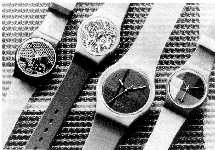
Die Swatch-Modelle Herbst/Winter 1985/86.

Identität, einer abenteuerlichen Note, wie ein Ausrufezeichen der Mode.