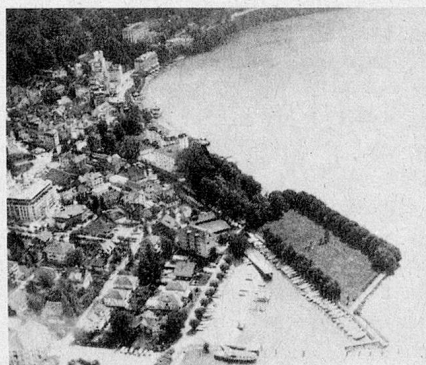
Hier soll der «Platz der Auslandschweizer» entstehen: die malerisch gelegene Halbinsel in der Bucht von Brunnen.

Als idealer Standort für den Auslandschweizer-Platz bietet sich eine direkt gegenüber dem Rütli gelegene baumbestandene Halbinsel in der Bucht von Brunnen an. Der Platz bildet damit den Abschluss des geplanten «Weges der Schweiz» um den Urnersee. Als permanentes Zeichen der Verbundenheit der Auslandschweizer mit ihrer alten Heimat und als Stätte der Begegnung soll der Platz über das Jubiläumsjahr 1991 hinaus bestehen bleiben.