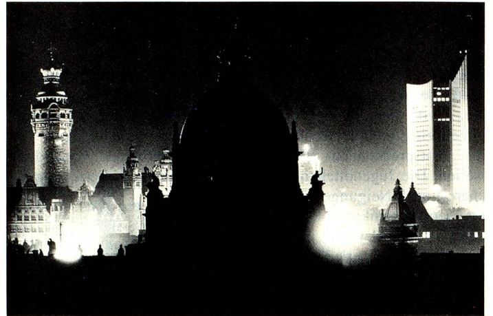
Die kontenführenden Geldinstitute in der DDR wandeln auf Antrag Devisenländerkonti in DM um. Unser Bild: Leipzig bei Nacht.

Im Zuge der Währungsumstellung in der Deutschen Demokratischen Republik wurde am 1. Juli 1990 die Deutsche Mark (DM) als Währung in der DDR eingeführt.