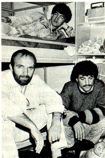
Hoffnung auf eine bessere Zukunft.

Die Situation spitzte sich mittlerweile derart zu, dass viele Kantone und Gemeinden an der oberen Grenze ihrer Aufnahmemöglichkeiten angelangt sind. Bereits waren Neuankömmlinge