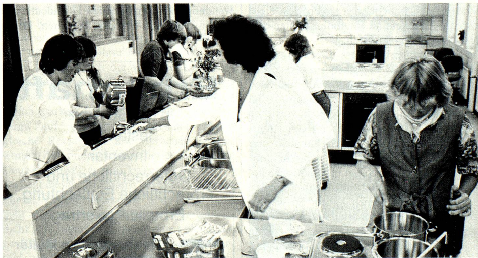
Gerade im praxisbezogenen Unterricht bevorzugen die Lehrer den schülernahen und «herrschaftsfreien» Dialekt.

Eine erste starke Gegenbewegung gegen diese kulturelle «Überfremdung» ging schon vor dem Ersten Weltkrieg von Bern aus und erfasste nach der Niederlage des Reichs bald die ganze deutsche Schweiz. Sie wurde verstärkt in der Nachkriegszeit mit ihrer Betonung der Demokratie und des Föderalismus, die beide in den verschiedenen Kantonsdialekten symbolisiert werden konnten, und erfuhr ihre staatliche Aufwertung in der Zeit der Geistigen Landesverteidigung, in der das Schweizerdeutsche als Bollwerk gegen den Nationalsozialismus of-