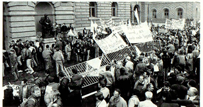
Schweizer Bauern wehren sich gegen drohenden Subventionsabbau.

Bauernvertreter können aber nicht darüber hinwegtäuschen, dass auch in der Schweiz – nicht zuletzt im Hinblick auf die bevorstehende Öffnung in Richtung EWR – Strukturbereinigungen in der Landwirtschaft unumgänglich geworden sind.