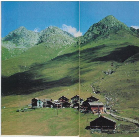
Juf im Aversal (GR), Walsersiedlung auf 2126 m ü.M. und zugleich höchstgelegenes dauernd bewohntes Dorf in Europa.

Die Anlage eines gut funktionierenden Verkehrsnetzes im einst riesigen Imperium gehört mit Sicherheit zu den faszinierendsten Zeugnissen römischer Baukunst, Planung und Technik. Auskunft über den Verlauf der Strassen oder vielmehr über wichtige Stationen erhalten wir durch das Itinerarium Antonini, ein römisches Reisehandbuch, sowie