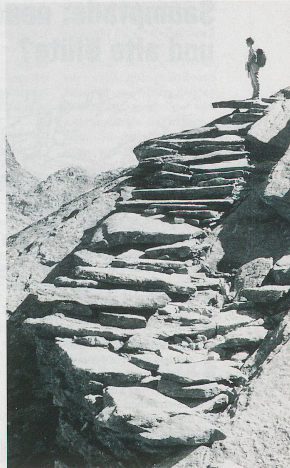
Ein alter Walserweg geht von Saas-Almagell über den Monte Moro nach dem Piemont.

Wenn man den Charakter der verschiedenen Walserwege genauer betrachtet,