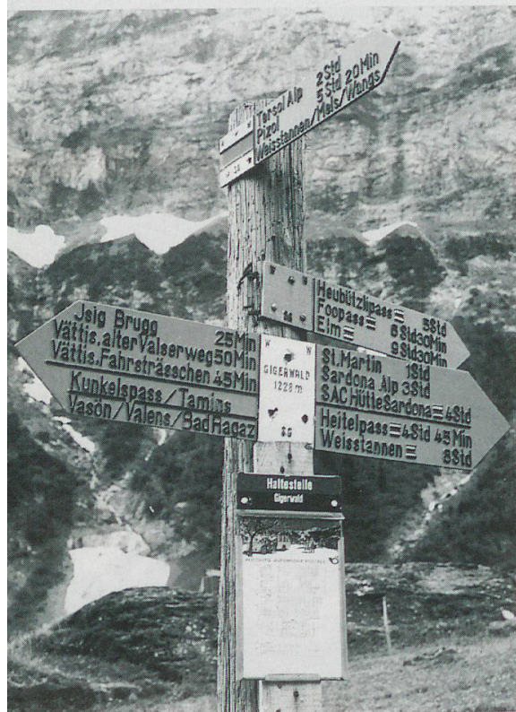
Walsenerwege sind heute Wanderwege; hier eine Verzweigung im Kanton St. Gallen.

Texte: Hans Schüpbach IVS-Pressestelle ■