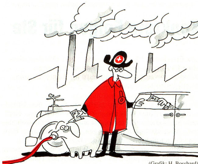
(Grafik: H. Bosshard)

Die alte ID behält natürlich weiterhin ihre Gültigkeit. ANP