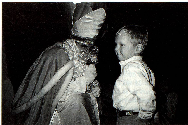
Ein Lied für den Samichlaus!