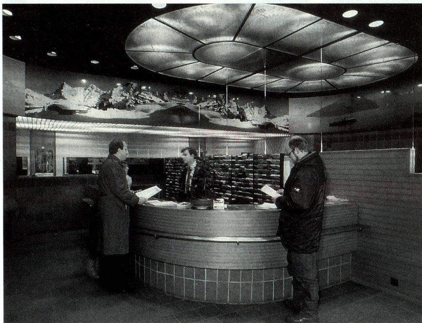
Sparen auch bei der Präsenz im Ausland? Zum Beispiel bei den Vertretungen der Schweizerischen Verkehrszentrale?