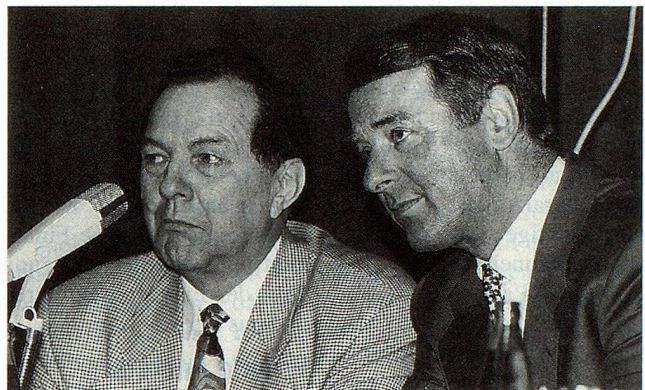
SVP-Bundesrat Adolf Ogi (rechts) an der Seite von Parteipräsident Hans Uhlmann.

der öffentlichen Sicherheit, auf den Abbau der Bürokratie, auf Deregulierung und insbesondere auf eine Ablehnung jeder Form der Integration der Schweiz in die Europäische Union legt.