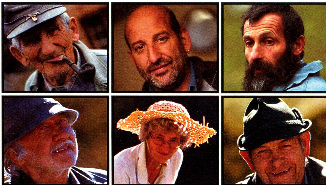
Menschen wie aus Holz geschnitzt.

Die Auflösung der staatlichen Monopole im Service public bringen die abgelegenen Gebiete in eine schwierige Situation. Ein Augenschein in unseren Sprachregionen zeigt Sorgen und Nöte der Bevölkerung, aber auch innovative Massnahmen, die gegen die drohende Aufhebung der flächen-deckenden Grundversorgung getroffen werden.