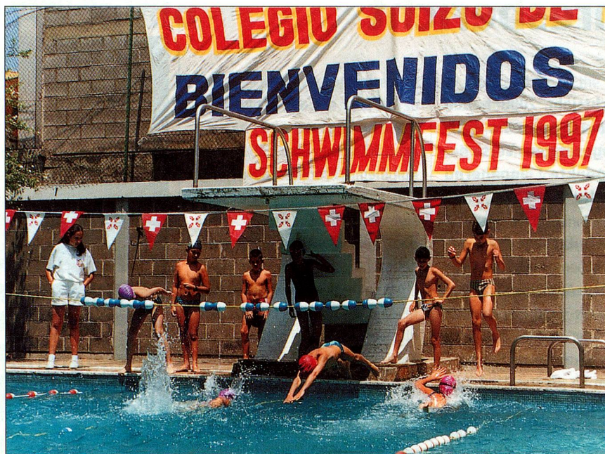
Sport gross geschrieben: Schweizerschule Mexiko.

«Sind Sie der Ansicht, dass die Auslandschweizerinnen und Auslandschweizer von Regierung und Parlament vermehrt beachtet werden sollten? Nehmen Sie an den Abstimmungen und Wahlen teil – dies ist der beste Weg, um sich Gehör zu verschaffen!»