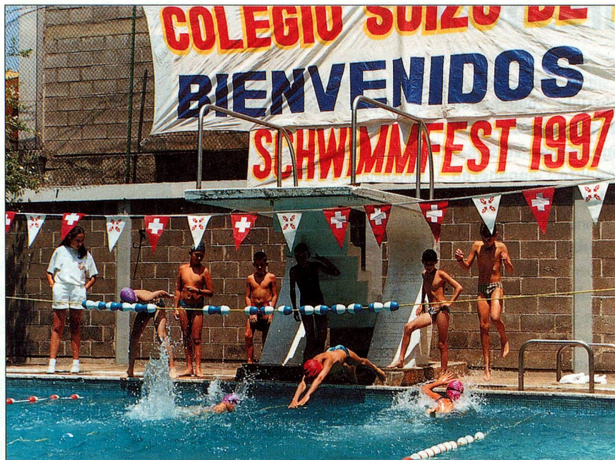
Sport gross geschrieben: Schweizerschule Mexiko.

«Sind Sie der Ansicht, dass die Auslandschweizerinnen und Auslandschweizer von Regierung und Parlament vermehrt beachtet werden sollten? Nehmen Sie an den Abstimmungen und Wahlen teil – dies ist der beste Weg, um sich Gehör zu verschaffen!»