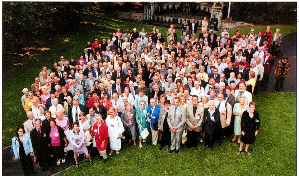
Das grosse Strahlen vor dem Kongresszentrum Davos.