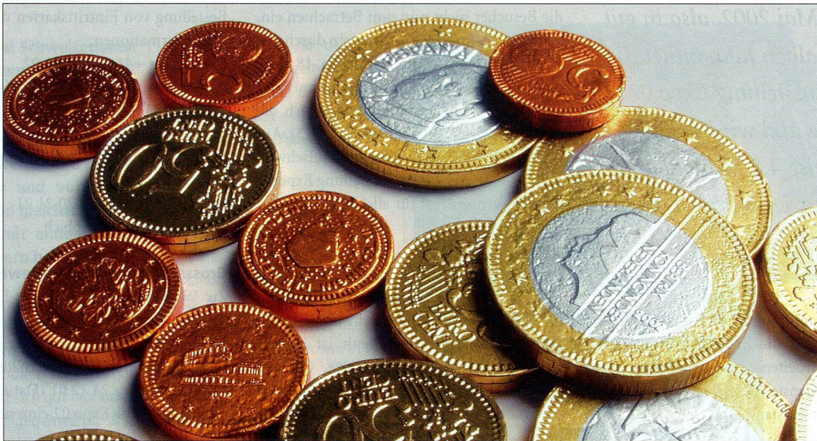
Wenn sie in der Schweiz auch nicht mehr gewechselt werden können, so sind Münzen doch auch eine schöne Erinnerung.

Die «Doppelwährungsphase» ist spätestens am 28. Februar 2002 zu Ende. Dies bedeutet, dass die alten Landeswährungen der zwölf Länder der Europäischen Währungsunion (EWU) ab diesem Datum nicht mehr als offizielle Zahlungsmittel zugelassen werden. Die D-Mark wird in Deutschland bereits am 1. Januar 2002 durch den Euro ersetzt. Der holländische Gulden verliert am 29. Januar, das irische Pfund am 9. Februar und der französische Franc am 18. Februar des nächsten Jahres die Gültigkeit als