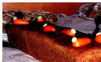
So lecker: Frau Generalkonsuls «Rüebli-Cake» für die Kasseler