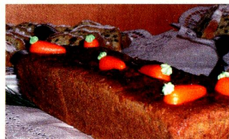
So lecker: Frau Generalkonsuls «Rüebli-Cake» für die Kasseler