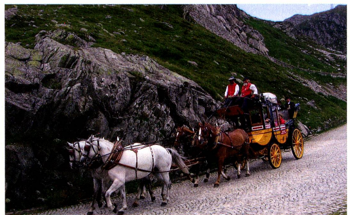
Die Gotthardkutsche in der Tremola