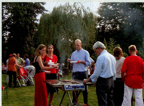
Die Schweizer Bratwürste schmecken allen vorzüglich.

17.00 Uhr Besammlung im Garten bei Familie van der Meer 17.30 Uhr Begrüssung und Eröffnung der Feier 18.00 Uhr Botschaft des Bundespräsidenten 18.30 Uhr Festansprache 19.00 Uhr Traditionelles Wurstessen und gemütliches