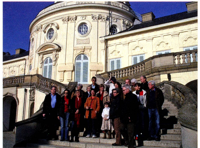
Die Romands auf der monumentalen Freitreppe von Schloss Solitude

Mit Besichtigung des Schlosses Solitude, Spaziergang durch den Wald bis zum Bärenschlössle und gemütlichem Beisammensein feierten die Romands ihren ersten Geburtstag.