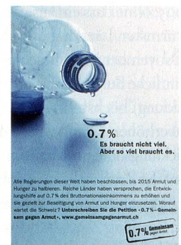
Inseratenkampagne der Schweizer Hilfswerke zum Projekt «0,7% - Gemeinsam gegen Armut»

(auch durch eine grosszügigere öffentliche Entwicklungshilfe).