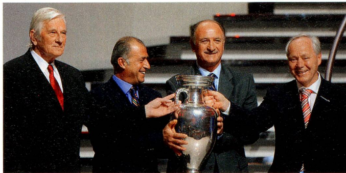
Fussball EM 2008 Auslosung: Der Trainer der Schweizer Fussball-Nationalmannschaft, Jakob «Köbi» Kuhn, Portugals Trainer Felipe Scolari, der türkische Trainer Fatih Terim und der tschechische Trainer Karel Brückner (von rechts) halten den Pokal bei der Gruppenauslosung für die Euro 2008 in Luzern am 2.12.2007.

Die Schweiz gehört in Sachen Logistik zur Weltspitze. Die Weltbank untersuchte 150 Länder und beurteilte deren Leistungsfähigkeit bei der Abwicklung internationaler Warensendungen. Die Schweiz belegt den 7. Rang.