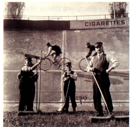
Radrennbahn, Zürich-Oerlikon, Dreissigerjahre.