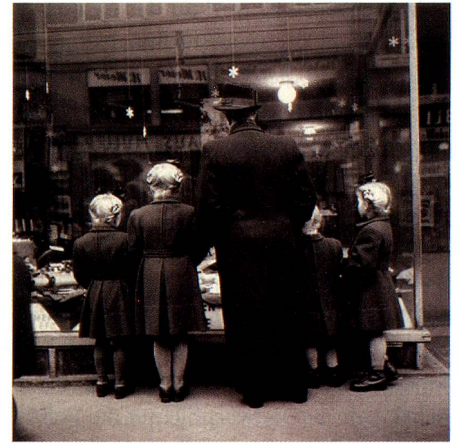
Silberner Sonntag, Zürich, 1948.