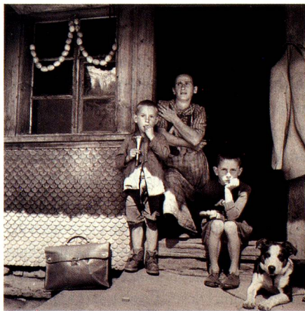
Flüchli, Entlebuch, 1941.