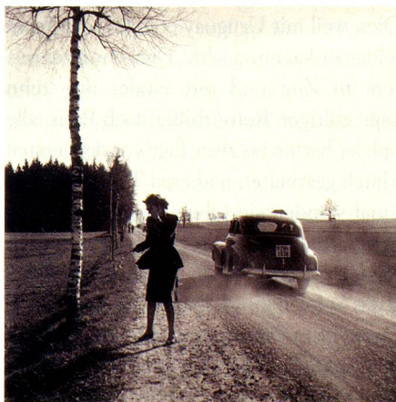
Strassenverkehr, Kanton Zürich, um 1949.