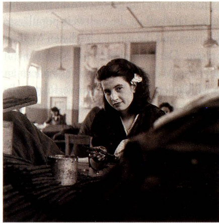
Tabakarbeiterin, Brissago, 1947.