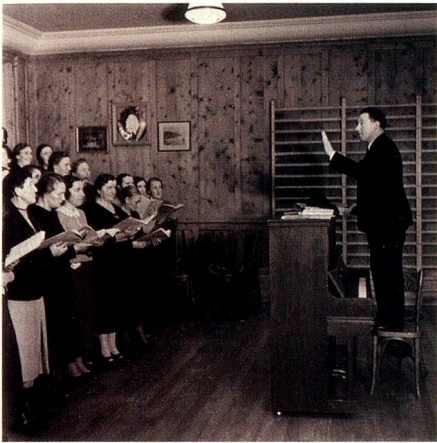
Gesangsprobe, Zuoz, 1939.