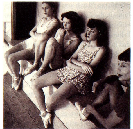
Tänzerinnen, Genf, 1941.