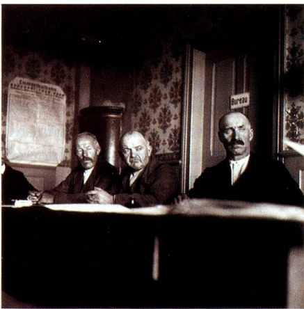
Gemeinderäte in Rüederswil, 1938.