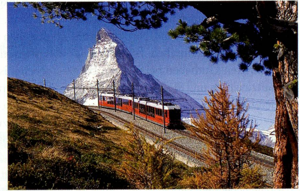
Gornergrat Bahn (VS).