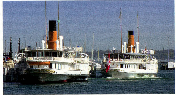
Dampfschifflotte auf dem Genfersee.