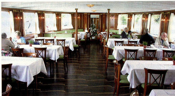
Dampfschiff auf dem Vierwaldstättersee.