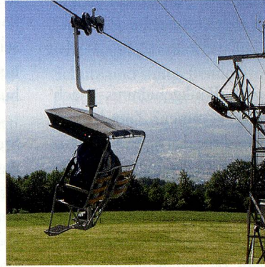
Sesselbahn Weissenstein (SO).