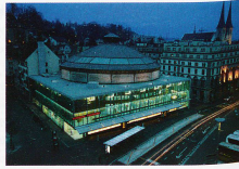
Das Kulturzentrum Panorama.

Edouard Castres' Riesengemälde im Luzerner Panorama fristete viele Jahre ein Mauerblümchendasein und war dem Vermögen nahe, als es Ende der Siebzigerjahre endlich zum Kunstdenkmal von nationaler Bedeutung erklärt und unter Denkmalschutz gestellt wurde. Nach der Restauration strahlt es nun wieder in neuem Glanz. Von Heinz Eckert