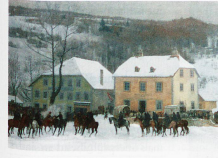
Kriegsdrama: Details aus dem Bourbaki-Rundbild.