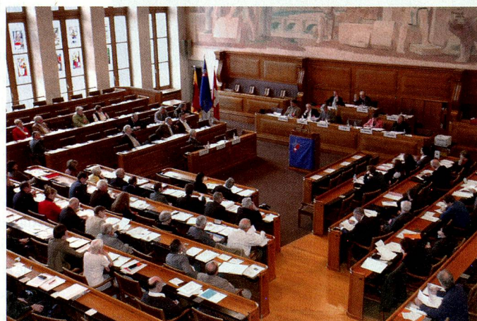
... tagte der Ausschwweizererrat.