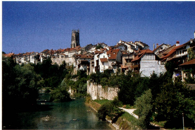
Der nächste Auslandschweizer-Kongress findet im schönen Freiburg statt.

Der Schweizer Beitritt zum Schengenraum bewegt die Fünfte Schweiz. Was wird aus der Schweiz, wenn sich ihre Grenzen auflösen, beziehungsweise dort die Personenkontrollen wegfallen? Was, wenn sie sich von Europa isolieren sollte? Die definitive Einführung der Personenfreizügigkeit unterliegt nämlich dem fakultativen Referendum. Die rund 670 000 im Ausland residierenden Schweizer sehen gebannt auf die Entwicklungen in ihrer Heimat. Grenzübergänge, Fremdsein, Stellensuche als Ausländer – all dies sind Themen, welche die Kongressteilnehmer aus eigener Erfahrung